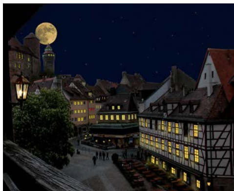
Die winterliche Nürnberger Altstadt

Nicht umsonst trägt die malerische Stadt Bamberg den Titel »Faszination Weltkulturerbe«. Ebenso wie Rom, wartet Bamberg mit einer zauberhaften Altstadt auf. Sozusagen ein Bilderbuch der Romanik, Gotik und Renaissance bis hin zum Barock. Wir sind überzeugt, ein »Bilderbuch-Ziel« für diese Reise über den Jahreswechsel ausgewählt zu haben. Unser Programm konzentriert sich dabei nicht nur ausschließlich auf die Weltkulturerbe Stadt. Bei einem Ausflug nach Nürnberg besuchen Sie die Burg mit Altstadt. Am Silvestertag besuchen Sie am Nachmittag das traditionelle Silvesterkonzert der Bamberger Symphoniker im Konzerthaus. Anschließend erwartet Sie in Ihrem Hotel ein festlicher Silvesterabend mit einem Gala-Buffer. Kann man den Jahreswechsel festlicher in einer frohen Gemeinschaft begehen?