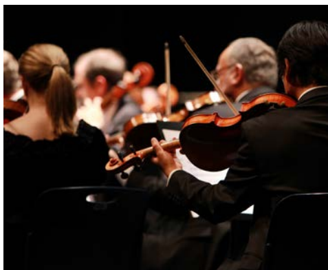
»Mit Beethovens Neunter ins neue Jahr«